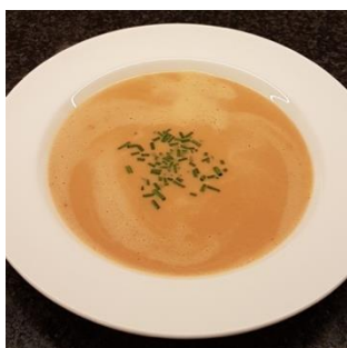
Heerlijke bisque van sterchef Marcel van der Kleijn.

De zalmproducten worden vers gevacumeerd en gekoeld geleverd. In de ijskast 2 weken houdbaar, tenminste 6 maanden in de vriezer. *indicatief, eindprijs op basis van reële gewicht