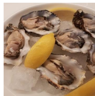
Verse oesters per dozijn, Umami of Gillardeau.

BESTELLEN graag uiterlijk 8 december op info@wijnkoperijvandenhoogen.nl of whatsapp 06-24 60 22 96 UITLEVEREN op de Hyacinthweg 71 of bezorgen na afspraak Wildernisvlees, Bosvarkentjesvlees en natuurlijk de beste wijnen: www.wijnkoperijvandenhoogen.nl